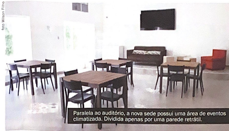
Paralela ao auditório, a nova sede possui uma área de eventos climatizada. Dividida apenas por uma parede retrátil.