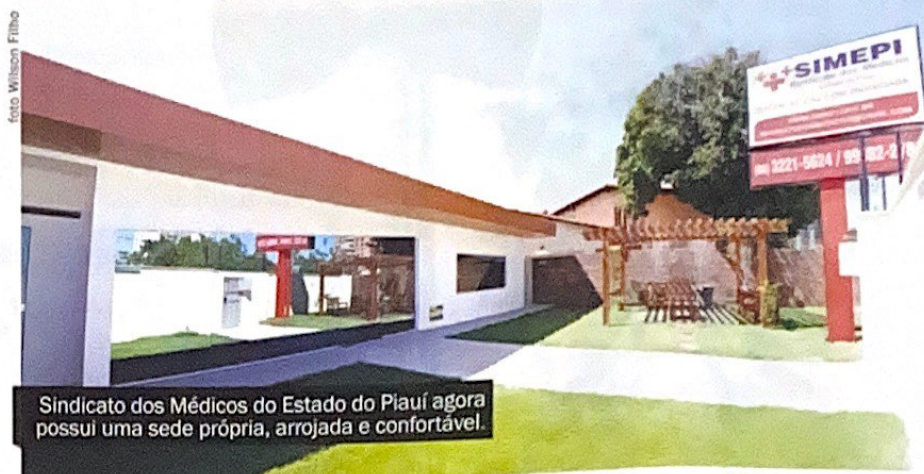
Sindicato dos Médicos do Estado do Piauí agora possui uma sede própria, arrojada e confortável.

Este sonho veio como forma de melhorar a qualidade e comodidade dos atendimentos que eram realizados cotidianamente na antiga sede, que era um imóvel cedido pelo Conselho