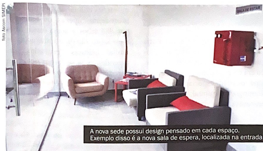
A nova sede possui design pensado em cada espaço. Exemplo disso é a nova sala de espera, localizada na entrada.